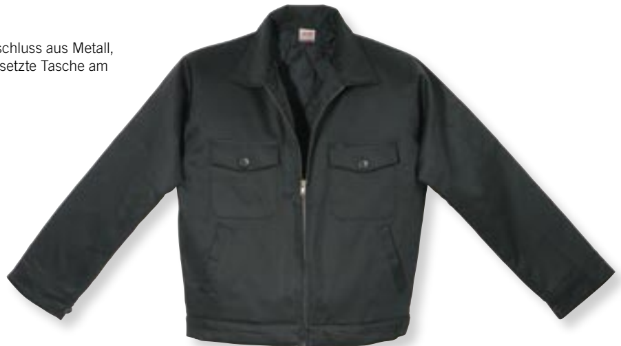
VE 1 St. · Karton 10 St. · Größen S-XXL