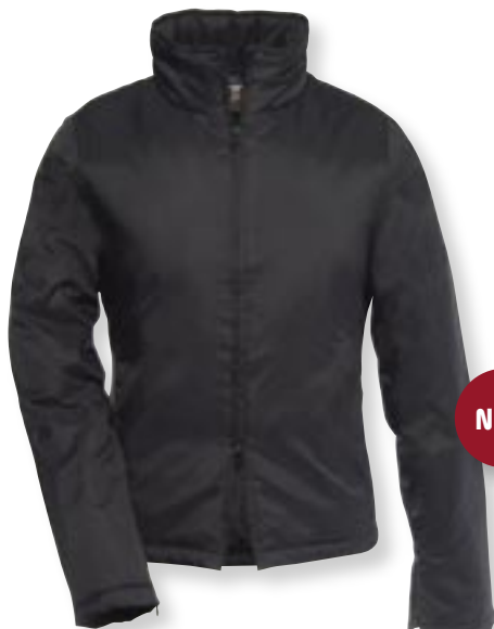
VE 5 St. · Karton 10 St. · Größen S-L

Außen: 100 % Taffeta Nylon, Innenfutter: 100 % Polyester