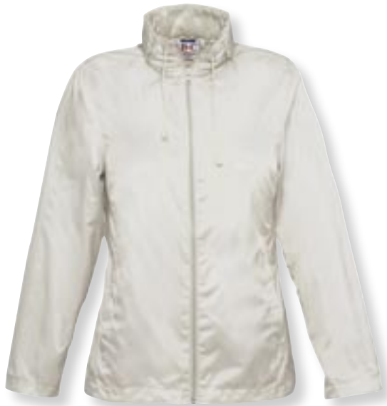
VE 5 St. · Karton 30 St. · Größen XS-XL

Außen: 100 % Taffeta Nylon, Innen: 100 % Polyester