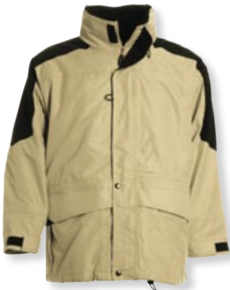
VE 1 St. · Karton 10 St. · Größen S-XXL

Außen: 100 % Nylon, Innen: 100 % Polyester