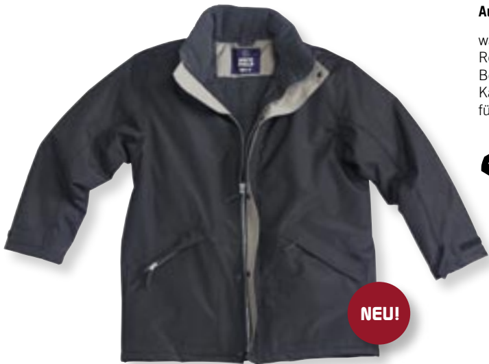
VE 1 St. · Karton 10 St. · Größen M-XXL

Außen: 100 % Nylon, Innen: 100 % Polyester