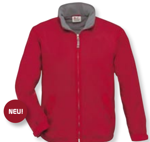
VE 5 St. · Karton 30 St. · Größen S-XXL