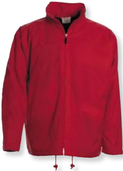
VE 5 St. · Karton 20 St. · Größen M-XXL

Außen: 100 % Nylon, Innen: 100 % Polyester