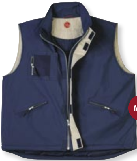
VE 1 St. · Karton 20 St. · Größen M-XXL