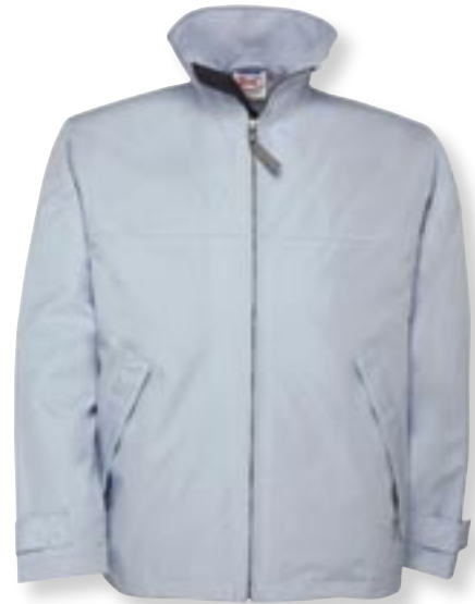
VE 5 St. · Karton 20 St. · Größen XS-XXL