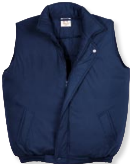
VE 5 St. · Karton 20 St. · Größen M-XXL

Außen: 35 % Baumwolle / 65 % Polyester, Innen: 35 % Baumwolle / 65 % Polyester