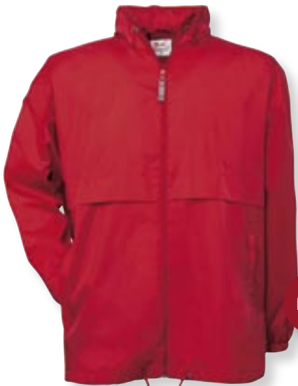
VE 5 St. · Karton 30 St. · Größen M-XXL

Außen: 100 % Taffeta Nylon, Innen: 100 % Polyester