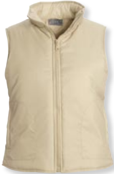
VE 5 St. · Karton 30 St. · Größen XS-XL

Außen: 100 % Taffeta Nylon, Futter: 100 % leicht wattiertes Polyester (150g/m 2 )